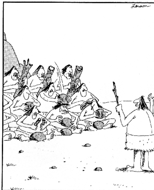
Soudain, le second granit ne peut plus contenir sa jalousie envers le premier granit.