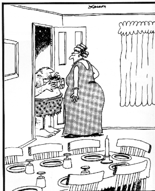
Le Premier Homme