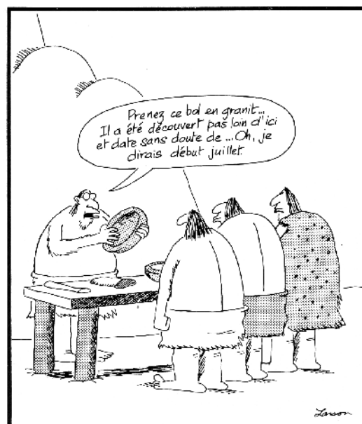
Les premiers archéologues

C'est au cœur de ces réflexions que j'ai découvert l'ouvrage de Yann Fastier. A sa première lecture, il m'est apparu évident que les aventures de Yob pouvaient être efficacement adaptées au théâtre pour susciter toutes ces questions.