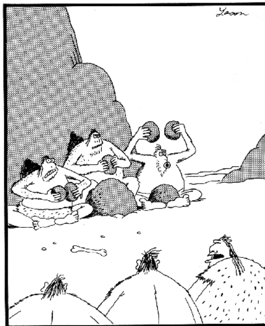
"Grog... Ils jouent notre chanson."

Grok. - Après, on n'a plus vu personne. Alors on s'est dit que finalement le public n'était pas mûr pour la simplicité et on a décidé de fermer notre grotte avec des gros cailloux pour ne pas qu'on la trouve avant au moins vingt mille ans, quand les gens auront renoué avec les vraies valeurs de la peinture simple.